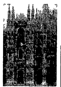
Fisco, domani sciopero generale a Milano

Sciopero generale sul fisco domani a Milano. Ma astensioni dal lavoro sono previste anche in molte altre città della Lombardia. Monza, Varese, Cremona, Brescia, Vigevano e Pavia. A Milano un lungo serpente di folla attraverserà il centro cittadino. Niente comizi alla fine, ma non per questo la manifestazione sarà senza «voce»: migliaia di palloncini colorati saranno fatti volare in cielo. Appesa a ciascuno di essi una lettera indirizzata a De Mita, chiede tasse più eque.