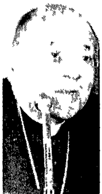
Il cardinal Ballestrero