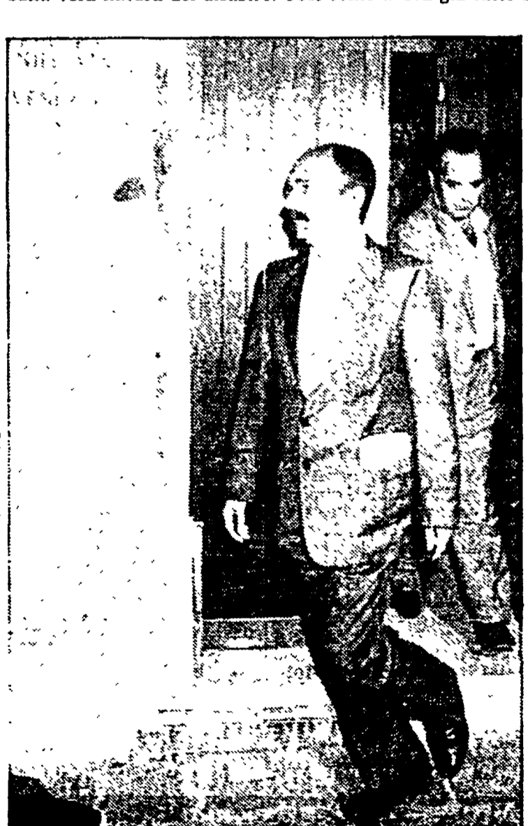
VENEZIA — Il generale Ambrogio Viviani mentre esce dalla pretura dopo l'interrogatorio dell'altra sera

ROMA — Paradossalmente, l'unico indiziato dell'infelice inchiesta giudiziaria sul giallo del Dc9 di Ustica fu il presidente dell'Itavia Aldo Davanzali, scopriamolo di aver parlato pubblicamente nell'84 dell'ipotesi di un missile vagante. Il primo titolare dell'indagine di competenza della procura di Roma, il Pm Giorgio Santacroce, lo convocò con una comunicazione giudiziaria per diffusione di notizie tendenziose o esagerate. Ma la pista del missile, col passare del tempo, non apparve poi tanto esagerata, e lo stesso Santacroce sembrò prediligere rispetto ad altre. In sei anni la magistratura ha formalizzato l'istruttoria con un dossier di richieste a ministeri e uffici governativi competenti, senza mai ottenere risposte esaurienti. Nemmeno il giudice istruttore Vittorio Bucarelli, attuale titolare dell'istruttoria, è riuscito a soddisfare le giuste curiosità sulla vera natura del disastro. Così come aveva già fatto Santacroce, nel lontano 1981, anche Bucarelli chiese infatti il recupero almeno di qualche pezzo del relitto in mare. Ma la risposta degli uffici che dovevano sborsare i soldi per l'operazione fu sempre la stessa: troppi i costi, e troppe le difficoltà.