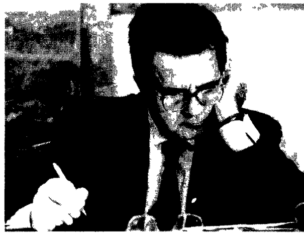
Il leader dell'Ulivo Romano Prodi

sa io. Non c'è niente da fare oggi Prodi non ne risparmia una al Cavaliere. La cui ossessione anticommunista anziché essere un argomento forte di campagna elettorale ancorché sbandierato dalla mattina alla sera in televisione questa volta è un segno di difficoltà. Per Prodi Berlusconi tenta e sarà il motivo conduttore delle