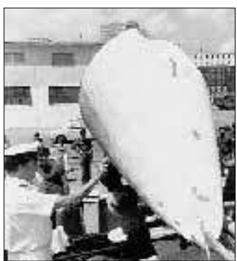
table tank (serbatoio di benzina di caccia militare Usa, ndr), le boe acustiche, i flares (razzi segnalatici recuperati in mare e nella zona del disastro, ndr), questi oggetti dimostrano la presenza Usa. È incontestabile. La portiera Saratoga, gli aerei «che proprio quel giorno, quella sera e quella notte si sono mossi e con operazioni significative»; i salvagenti recuperati «che provano che su quelle coordinate sono state eseguite operazioni di soccorso» (furono ripescati il 29 giugno del 1980, ndr);

Al di là «della presunzione di ordine generale della onnipresenza e potenza militare - che a rigore non avrebbe alcun valore sul piano giuridico - vi è una molteplicità di fatti, da cui potrebbe con alto grado di probabilità desumersi il coinvolgimento di entità statunitensi: la portiera, i velivoli, i salvagenti, il drop-