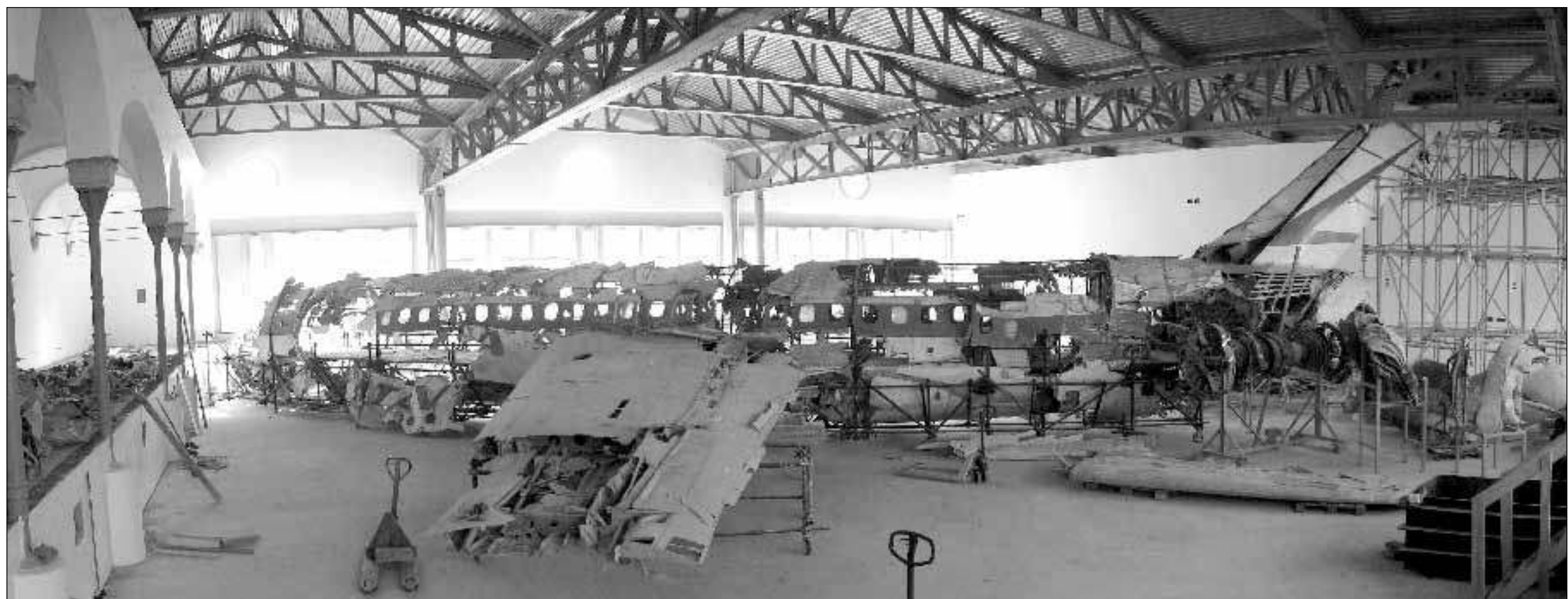
Nello spazio del Museo di Ustica, la carcassa del Dc9 Itavia ricostruita come un puzzle con i frammenti ripescati dal mare. Sotto, uno zoccolo di legno appartenuto a uno dei passeggeri del volo

vata». Obiettivi ambiziosi, quelli del museo, e una sfida per Boltanski, uno dei più importanti artisti viventi che ha sempre lavorato sul tema delle vite «qualsiasi» e dei fantasmi, vita e morte anonimi e per questo universali, ma mai su morti con nome e cognome. L'artista si è trovato all'inizio «senza parole davanti al relitto di Ustica», racconta Lorenzo Sassoli de Bianchi, presidente della Galleria d'arte moderna di Bologna. Addosso, la responsabilità di interpretare una tragedia passata ma ancora vicina per i parenti delle vittime. Da qui la scelta di celare alla vista gli oggetti di vita quotidiana dei passeggeri. Abiti, canottiere, scarpe, racchette da tennis, pinne, bambole sono stati poi fotografati e le loro immagini - volutamente sgranate, quasi a mitigarne l'impatto e a tutelare la privacy di chi li ha posseduti - riunite in un piccolo, impressionante libretto consegnato ai visitatori. Sulla copertina, uno zoccolo spezzato.