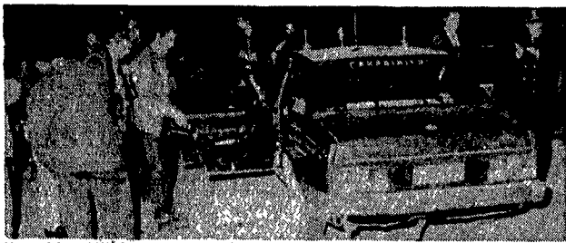
L'auto dei carabinieri colpita dal killer. Ora riprende quota la pista terroristica